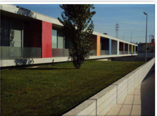
Centro Escolar Quinta do Vieira Educação Pré-Escolar e 1.º ciclo