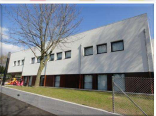
Escola Básica da Lomba Educação Pré-Escolar e 1.º ciclo