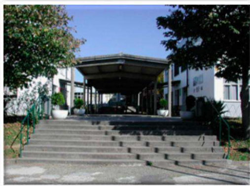
Escola Básica de Custoias 2.º e 3.º ciclos