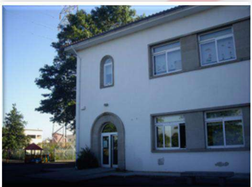
Escola Básica de Sendim Educação Pré-Escolar e 1.º ciclo