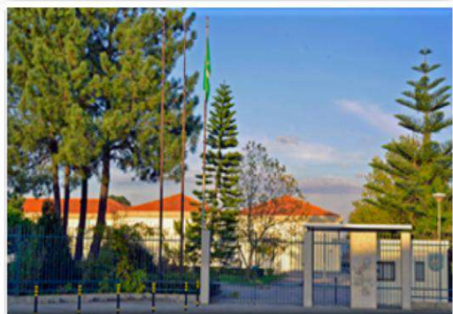
SEDE Escola Básica Irmãos Passos Educação Pré-Escolar, 1.º, 2.º e 3.º ciclos