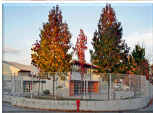
Escola Básica de Santiago Educação Pré-Escolar e 1.º ciclo