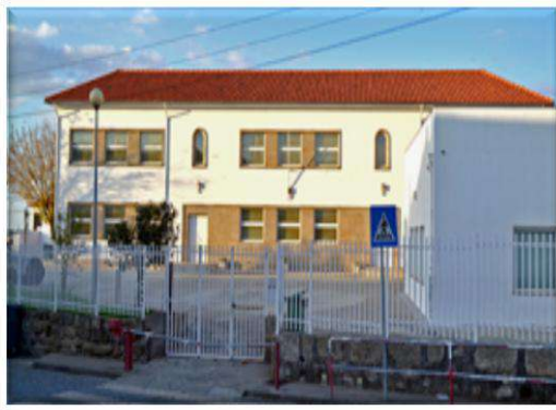
Escola Básica Prof.ª Elvira Valente Educação Pré-Escolar e 1.º ciclo